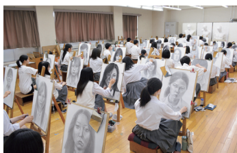
デッサンコンクール（全学年）