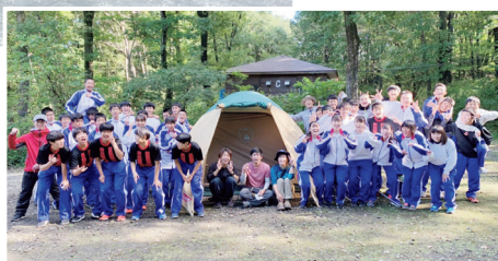
野外実習 (キャンプ実習)