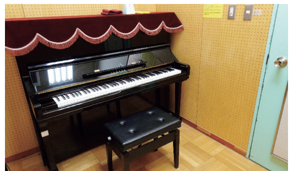
練習室 (9部屋) アップライトピアノ各室1台設置