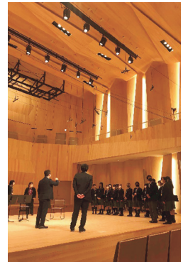
大学見学会 （桐朋学園大学 宗次ホール）