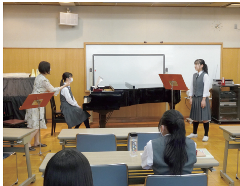
親子ガイダンス（公開レッスン）