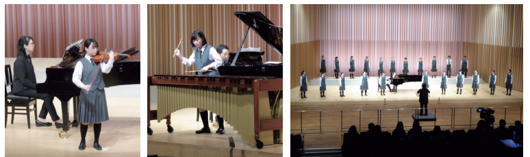
音楽コース演奏会