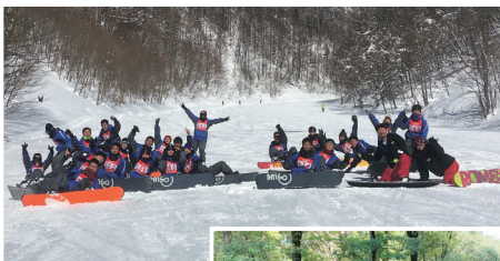
スキースノーボード 実習