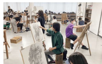
校外デッサン講習会（1年生）