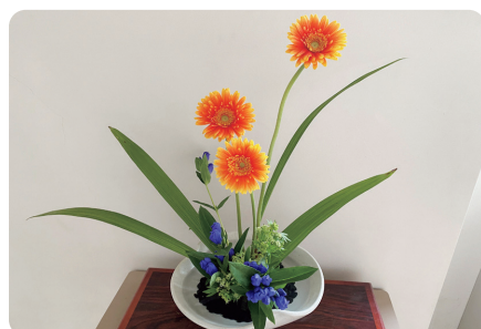
伝統三道部（茶道・華道・書道）