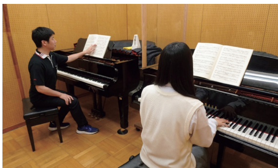
レッスン室 (5部屋) グランドピアノ各室2台設置